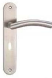
图 2 门把手