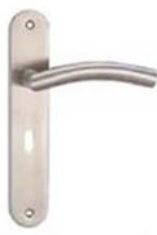
图 2 门把手