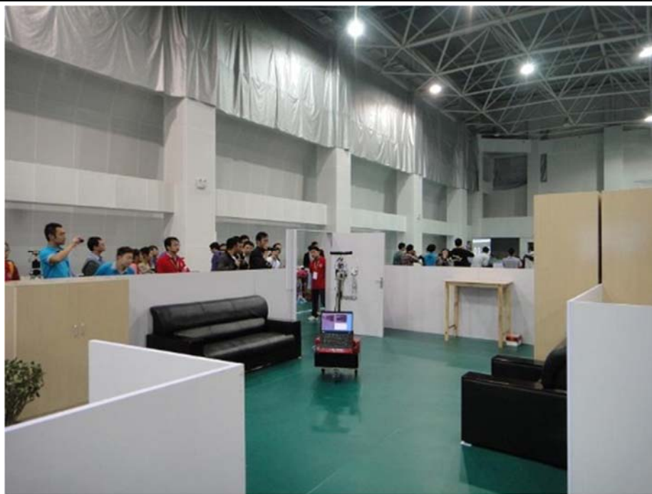
图 1 大赛实拍图