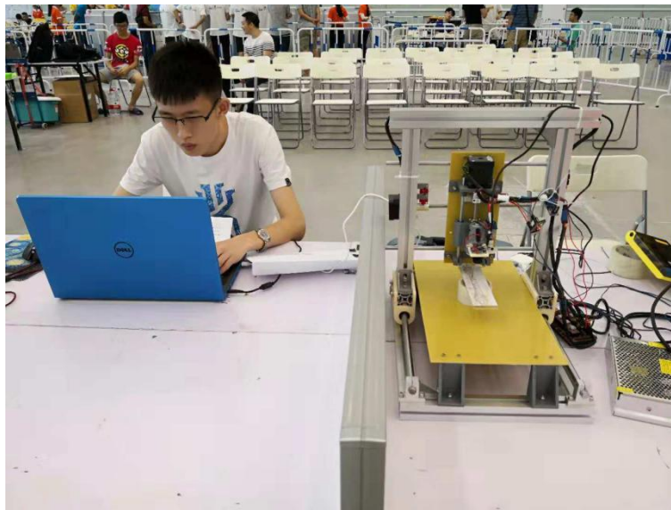
图 4 2019 年参加本赛项比赛的 1 台机器人

2019 年参加本赛项比赛的机器人如图 4 所示。骨科手术机器人系统有两部分组成，（1）骨科手术医生主控台（2）骨科手术床旁系统。其中，骨科手术医生主控台主要由 PC 及运行其上的骨科手术系统软件组成；骨科手术床旁系统主要有导轨、支架、基板、电机固定装置、摄像头、PC 及运行其上的骨科手术系统软件组成。选手在医生主控台通过摄像头传来的视频了解床旁系统的情况，发出指令控制骨科手术床旁系统工作。