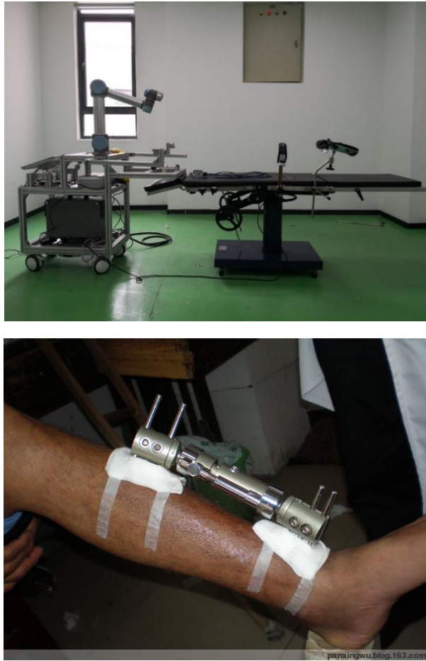
图 1 骨科手术图片

本赛项机器人模拟骨科定位手术进行定点打孔，机器人的机械臂在主控台医生的控制下自动定位，精准完成打孔。