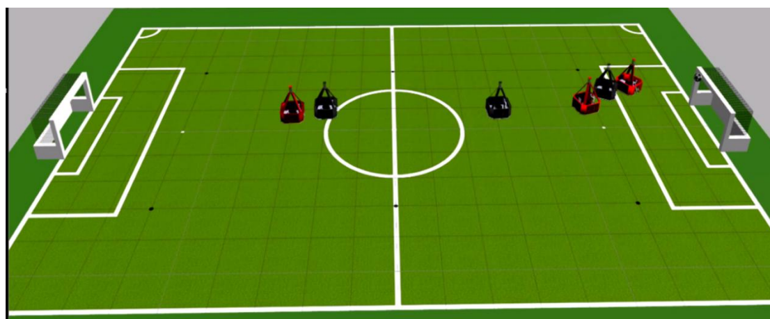
图 1 用于中型组仿真比赛的仿真环境

如图 11 所示，比赛在 22mX14m 的仿真绿色地毯场地上用标准足球进行。每个队的机器人不能多于 5 个。机器人必须是全自主的和全分布的，机器人之间通过发布/订阅 ROS 话题进行通讯，并基于通讯协调、协作。所有参赛队使用统一的仿真机器人模型，任何参赛队未经允许不得改变仿真机器人模型参数。